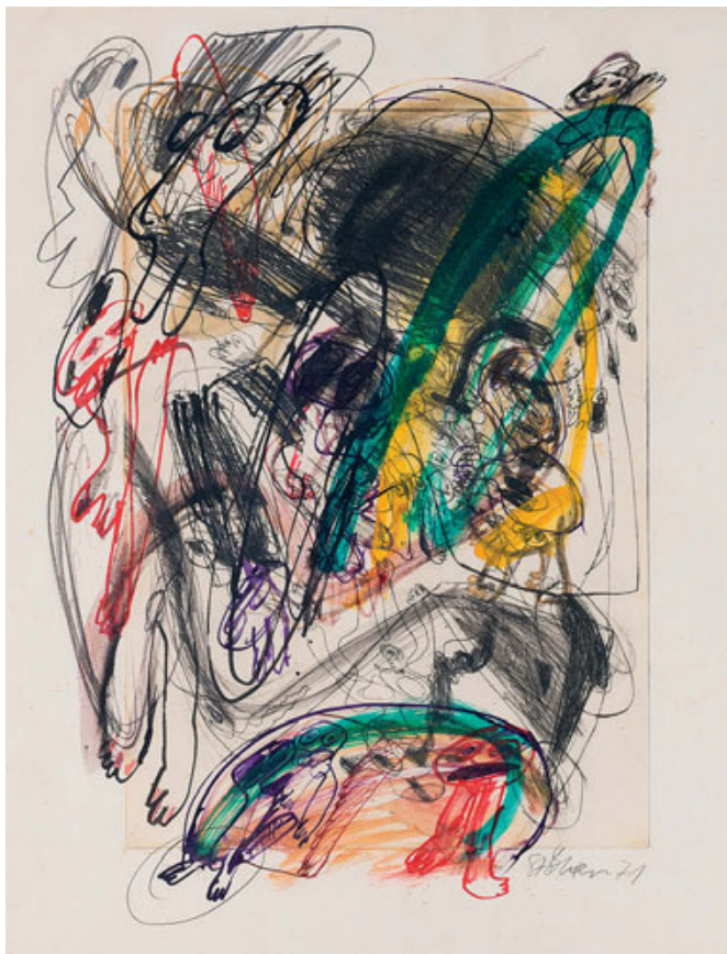
Walter Stöhrer (1937–2000) Ohne Titel, 1971 übermalte Radierung, 76,5 × 64,3 cm signiert und datiert