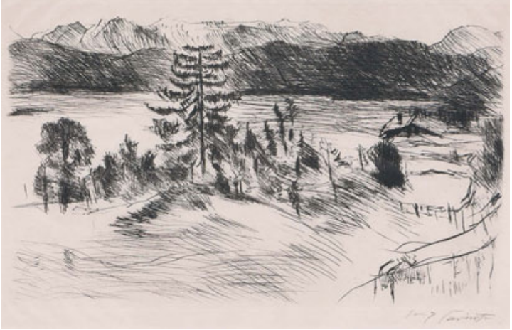
Lovis Corinth (1858–1925) Große Walchenseelandschaft, 1923 Radierung auf Bütten, 29,6 × 48,7 cm signiert