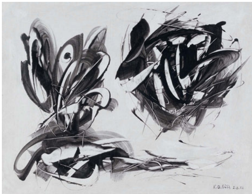
Karl Otto Götz (1914–2017) 2.8.1952, 1952 Gouache auf Papier, 50 x 65 cm signiert und datiert