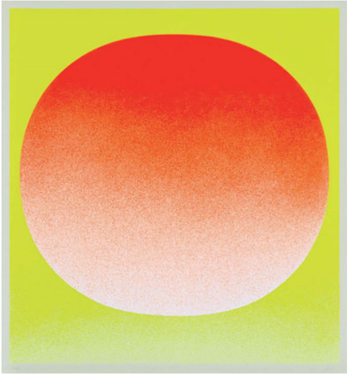
Rupprecht Geiger (1908–2009) Color in the round, 1969 Serigrafie auf Halbkarton, 67 × 62,2 cm signiert