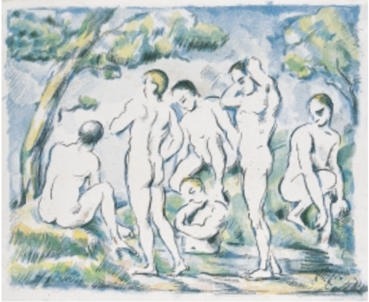
Paul Cézanne (1839 Aix-en-Provence–1906 Aix-en-Provence) Les Baigneurs – Petite Planche, 1896/97 Farblithografie auf Büttenpapier, 22,8 x 28,6 cm (28 x 35,5 cm) Werkverzeichnis Venturi 1156, 4. (letzter) Zustand Werkverzeichnis Johnson 22 Provenienz: Süddeutsche Privatsammlung