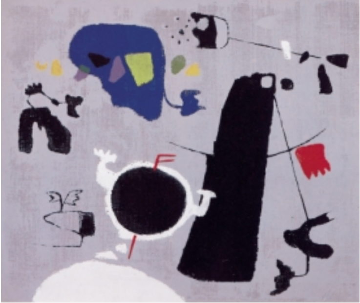
Willi Baumeister (1889 Stuttgart–1955 Stuttgart) Kosmische Geste, 1950 Serigrafie auf Karton, 54,6 x 64,7 cm (70,2 x 61,8 cm) signiert und nummeriert Auflage: 40 nummerierte und signierte Exemplare Werkverzeichnis Spielmann/Baumeister 168